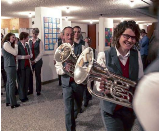
Las musicàntas ad igls musicàntas pronts par igl concert anual igl favrer 2020.