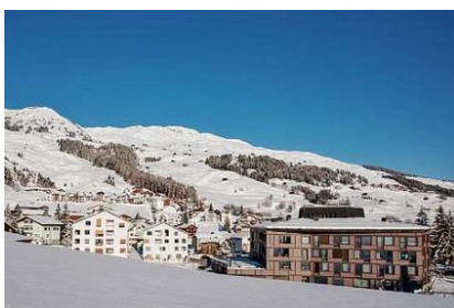
Il Da Casa Val Lumnezia a Vella enquera ina nova meinacasa.