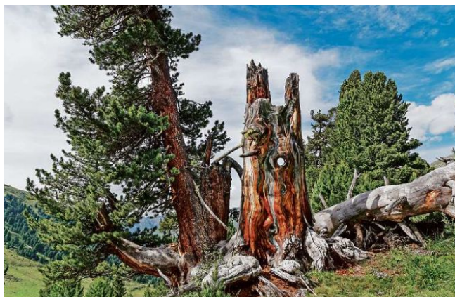
Il God da Tamangur es il plü ot situà god da dschembers d'Europa.